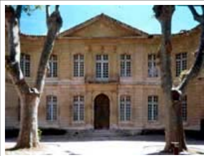
Fachada Hotel Caumont

Desde el 17 de junio del año 2000, la ciudad de Avignon cuenta con un nuevo espacio para la exposición y difusión del arte contemporáneo y actual. La idea parte del galerista, coleccionista y marchante Yvonne Lambert que coincidiendo con la capitalidad cultural de Avignon en el año 2000 propone la creación de un espacio expositivo para el arte contemporáneo, espacio del que la ciudad carecía hasta el momento. El lugar seleccionado es el hotel Caumont del siglo XVIII que es restaurado para acoger las obras, uniendo tradición y